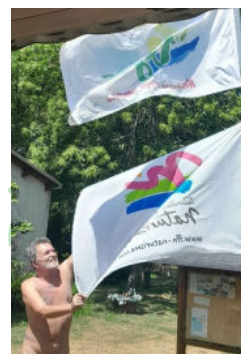
Le levée des couleurs à l'effigie du CGO et de la FFN