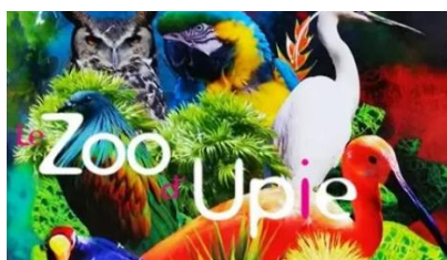
Visite naturiste Zoo de Upie (Drôme) en juin 2023