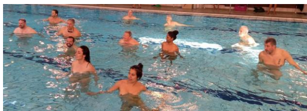
Le tournoi Régional de Natation Naturiste en mars à St Quentin Fallavier (CS Nord-Isère)