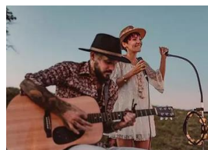
Un interclubs très musical au Gymnoclub Rhodanien le 18 juin 2023